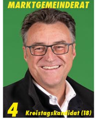
4 Kreistagskandidat (18)

Mein Antrieb: „Belange von Kindern und Jugendlichen stärken, Verkehrssicherheit, mehr Stadtgrün und Aufenthaltsqualität für ein lebenswertes Bruckmühl“