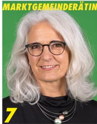
7 Kreistagskandidatin (18)

Bodenständig und zupackend, die richtige Wahl um fachliche Kompetenz in den Rat zu bringen.