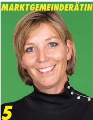
5 Kreistagskandidatin (18)

Wertschätzung, Miteinander ohne Ausgrenzung, Akzeptanz ist Teil unserer Demokratie und unserer Werte und muss erhalten bleiben.