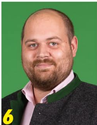
6 Kreistagskandidat (20)

Mir sind Tempo 30, sichere Wege und eine gute Ortsgestaltung wichtig - für mehr Lebensqualität und einen lebendigen Ort, in dem sich Jung und Alt sicher und wohlfühlen.