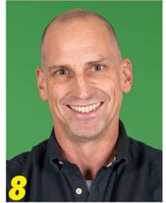
8 Kreistagskandidat (18)

Für eine Zukunft, in der wir verantwortungsvoll leben und kommenden Generationen Chancen sichern. Regional denken, klug handeln.