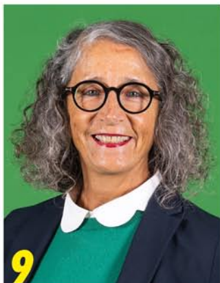
9 Kreistagskandidatin (18)

Meine Fokusthemen: Eine starke Demokratie, eine moderne Verkehrspolitik, verbesserte Wohnqualität und sichere Schulwege.