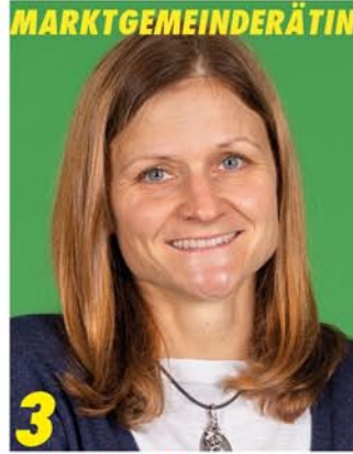
3 Kreistagskandidatin (18)

Ich stehe für nachhaltige, ehrliche und bürgernahe Politik - mein Ziel: Meinungsstark weitere sechs Jahre im Marktgemeinderat mitgestalten.