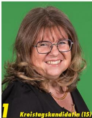
1 Kreistagskandidatin (15)