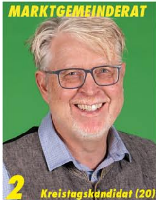
2 Kreistagskandidat (20)

Vorstand der Grünen in Bruckmühl, aktiv in der Asylhilfe Bruckmühl. Für eine zukunftsfähige, soziale und familienfreundliche Gemeinde, mit Herz und Vernunft.